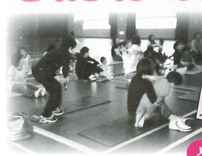
子育て支援委員会(清明地区)

地域ごとに地域の実情に応じた子育て支援策を企画し、実施しています。H15年度は8地区からスタートし、H19年度からは全48地区で行われています。