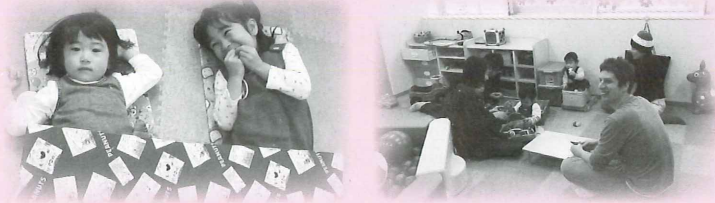
☎福井市男女共同参画・子ども家庭センター 相談室 ☎20-1541 ☆相談無料 ㊤毎週火曜日

また、子どもに関する悩みや、女性に関する悩みを相談することができる相談室ができ、電話相談はもちろんのこと(8ページ子育てママダイヤル参照)、面接相談や医師・弁護士による専門相談も行われています。