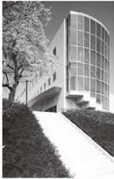
福井市自然史博物館