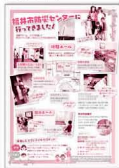
P5「福井市防災センターに行ってきました!」