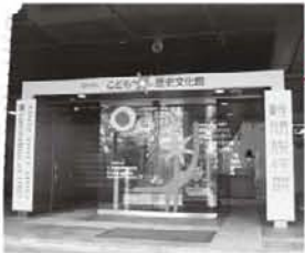
福井県立子ども歴史文化館

リーズナブルに遊べて子どもも楽しめる公共施設の紹介がたっぷり。雨の日にお出かけできるスポットもありますよ。