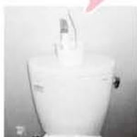
トイレの洗剤とブラシ