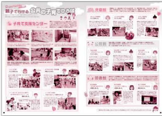
P4~5「親子で行ける公共の子育てひろば」