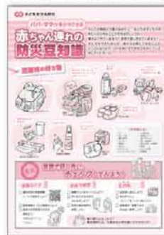
P2「赤ちゃん連れの防災豆知識」