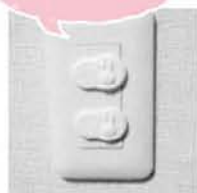
コンセントキャップ