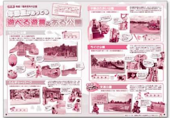
P4~5「年齢差があっても遊べる遊具のある公園」

これで足羽山の全体像がわかる!昨年9月には足羽山公園遊園地がリニューアルオープンしました。チェックして足羽山へ出かけよう。