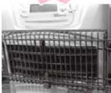
ファンヒーターガード