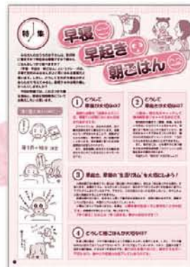
P2、P4「早寝 早起き 朝ごはん」