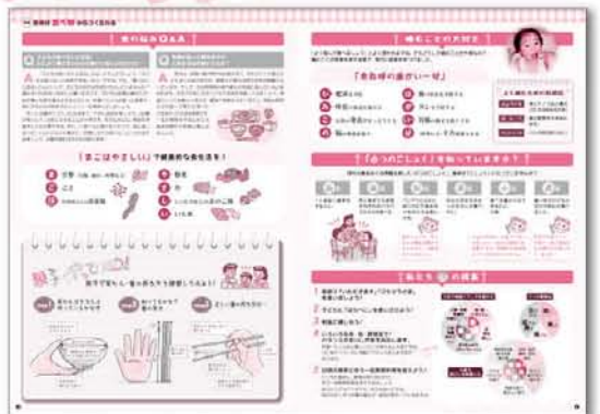
P4~5「身体は食べ物からつくられる」