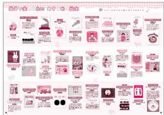
第24号 P4~5「おはなしの世界を旅しよう!」