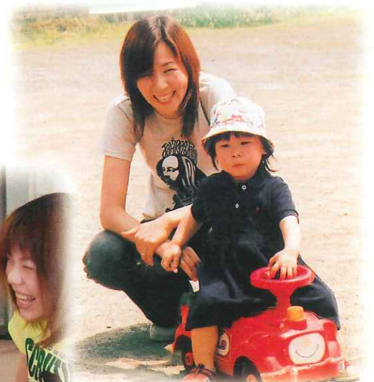
すくすくキッズ(旧清水町)