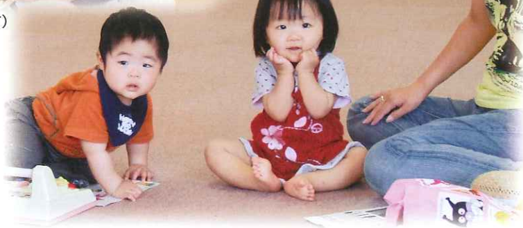
育児相談(旧越廼村)