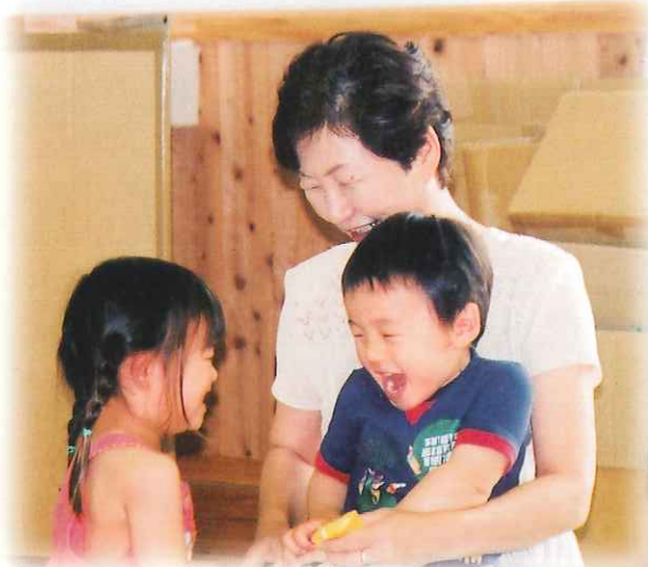
びよんびよんルーム(旧美山町)