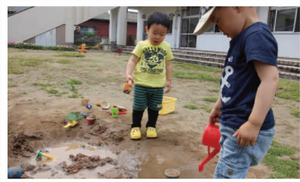
広い園庭では砂遊びや遊具で遊べます。夏にはプール遊びもできますよ。