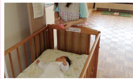
上のお子さんと一緒に赤ちゃんを連れて来るお母さんも安心。赤ちゃんも安全に楽しめるお部屋もあります。