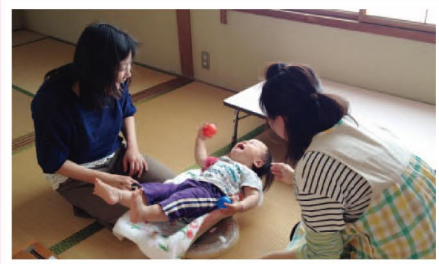
助産師、歯科医など専門家の相談会も定期的に行なわれます。また体重や身長を測ったり、食事や栄養に関する相談はいつでもできます。