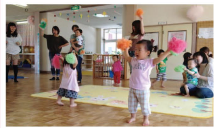
広々としたホールでは、滑り台や大きなボールで思いっきり遊べます。体操の時間もありますよ。

季節ごとのさまざまなイベントに参加できたり、広々としたホールや園庭もあるので家の中ではなかなかできない遊びを親子で楽しむことができます。月齢に合わせたおもちゃやベビーベッドなどもあるので、お子さんとお出かけデビューの場所としてもおすすめです。