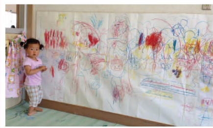
工作室では、粘土遊びや折り紙などが楽しめます。壁一面に画用紙が貼ってあり、落書きもできます。