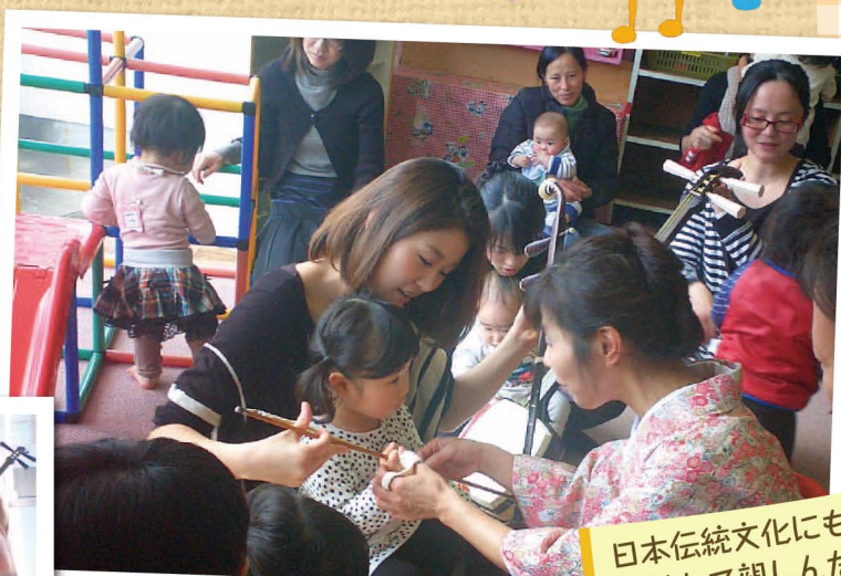
日本伝統文化にも 触れて親しんだよ