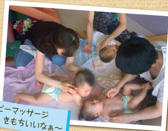
ベビーマッサージ きもちいいなあ〜