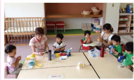
12時からはランチタイムになります。テーブルを囲んで賑やかにお弁当を楽しみます。みんなで食べるお昼ご飯は美味しいね!